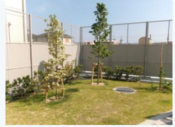
公園の緑化(姫路市)